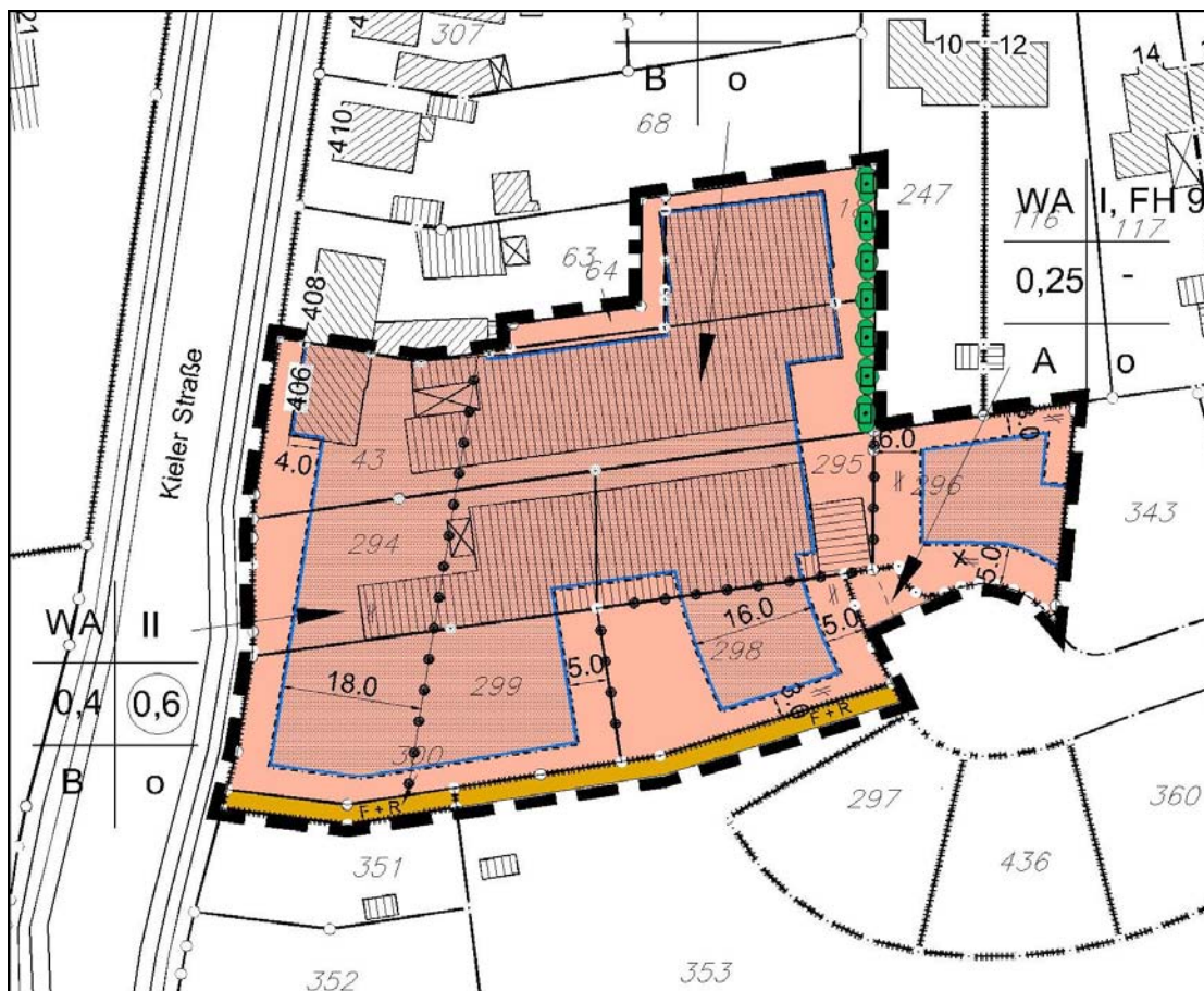
Geltungsbereich der 2. Änderung mit möglichen Festsetzungen