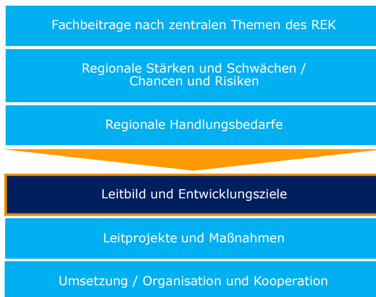
Abb. 1 Einordnung des Leitbilds in den REK-Prozess

In einem Leitbild werden die Vorstellungen über die gewünschte Entwicklung einer Region zusammengefasst. Insofern dient ein Leitbild als Richtschnur für das Planen und Entscheiden möglichst vieler Akteure in den unterschiedlichsten Bereichen. Über seine Orientierungsfunktion hinaus steckt ein Leitbild den Rahmen für die regionale Entwicklung ab. Dabei werden zwar noch keine Einzelaktivitäten formuliert, jedoch werden inhaltliche Akzente in Form von Entwicklungszielen gesetzt. Grundbedingung für die Umsetzung eines Leitbildes, von Entwicklungszielen und von Leitprojekten ist, dass ein hoher Konsens in der Region besteht.