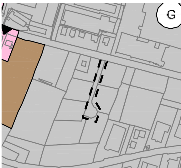
Ausschnitt aus dem geltenden FNP, o.M.

Aus der geltenden Landes- und Regionalplanung ergeben sich ebenfalls keine Einschränkungen für die Planung.