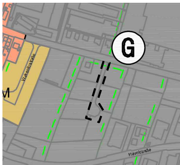
Ausschnitt aus dem Landschaftsplan, o.M.