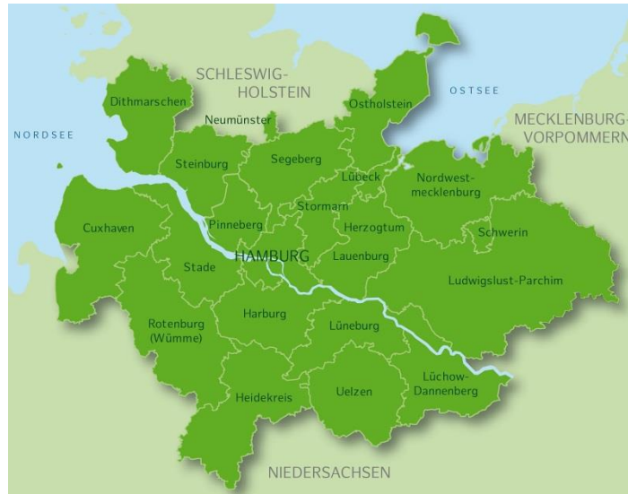
(Grafik: Geschäftsstelle der Metropolregion Hamburg)

Koordinierung der 7 Kreise und 2 kreisfreien Städte (SH) in der Regionalkooperation